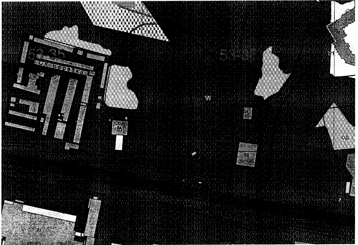
Схема расположения земельного участка с кадастровым номером 67:27:0020463:8 по адресу: Российская Федерация, Смоленская область, город Смоленск, Краснинское шоссе